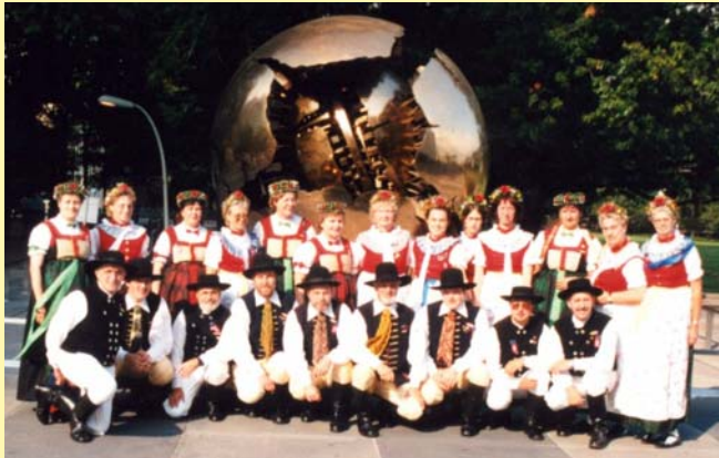
in New York