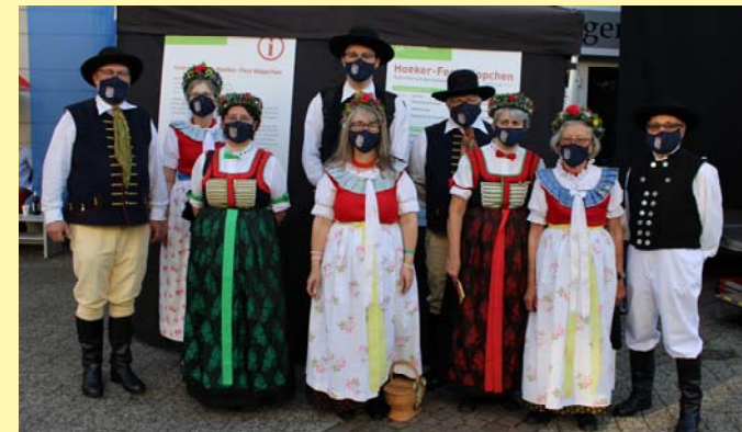
Hoekerfest-Häppchen in Herford

Nach knapp 2 Jahren mit überwiegend virtuellem Kontakt konnten wir endlich wieder vor Publikum tanzen. Der Schritt, nach der Corona Pause, war ein großer Schritt zurück in unsere Kulturarbeit.