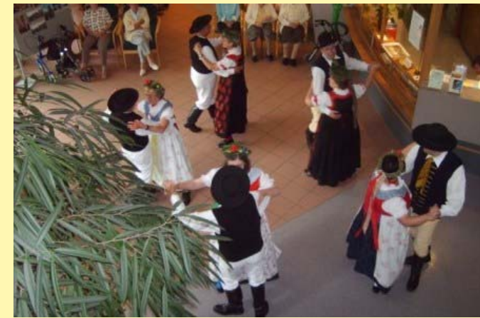
Auftritt in einem Seniorenzentrum

Im September 1998 nahmen wir zum ersten Mal an der Steubenparade in New York teil. Für uns alle ein unvergeßliches Erlebnis.