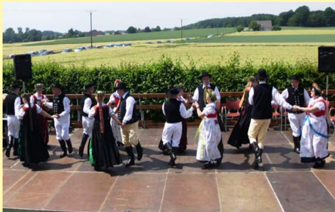
in Melle - Riemsloh